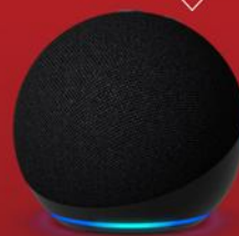
ECHO DOT 5ª GERAÇÃO