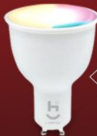
LÂMPADA INTELIGENTE DICRÓICA GU10 WI-FI GEONAV

Oferta válida para pessoa física e exclusivamente para as lojas próprias da Claro e/ou através do QR Code e enquanto durarem os estoques. Parcelamento em 12 vezes sem juros exclusivo para cartões de crédito do Banco do Brasil, CAIXA Econômica Federal, Banco Original e Santander. Consulte cobertura do serviço, restrições, benefícios inclusos e demais condições da oferta em www.claro.com.br . Imagens meramente ilustrativas.