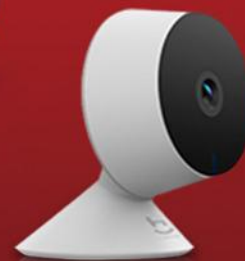
CÂMERA INTELIGENTE FULL HD 1080P WI-FI GEONAV